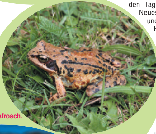
Bodo, der Grasfrosch.

Heute ist Vetter Bodo zu Besuch. Er ist ein brauner Grasfrosch und gemeinsam schwimmen sie im Teich um die Wette. Jojo hat die Nase vorne und kann heute das Wettswimmen gewinnen. Die dicke braune Erdkröte Elfriede sitzt am Ufer und schaut ihnen dabei zu. Sie hat keine Lust zum Mitmachen, da sie für die beiden Burschen im Wasser einfach zu langsam ist. Schwimmen macht hungrig, und so beschließen die beiden, erst einmal ordentlich zu frühstücken. Mit seiner langen, klebrigen Zunge schnappt sich Jojo Fliegen, Maden und Würmer. Ihr meint viel-