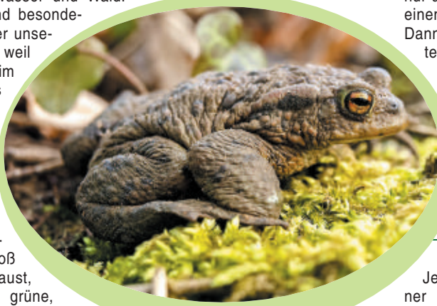
Elfriede, die Erdkröte

Heute ist Vetter Bodo zu Besuch. Er ist ein brauner Grasfrosch und gemeinsam schwimmen sie im Teich um die Wette. Jojo hat die Nase vorne und kann heute das Wettswimmen gewinnen. Die dicke braune Erdkröte Elfriede sitzt am Ufer und schaut ihnen dabei zu. Sie hat keine Lust zum Mitmachen, da sie für die beiden Burschen im Wasser einfach zu langsam ist. Schwimmen macht hungrig, und so beschließen die beiden, erst einmal ordentlich zu frühstücken. Mit seiner langen, klebrigen Zunge schnappt sich Jojo Fliegen, Maden und Würmer. Ihr meint viel-