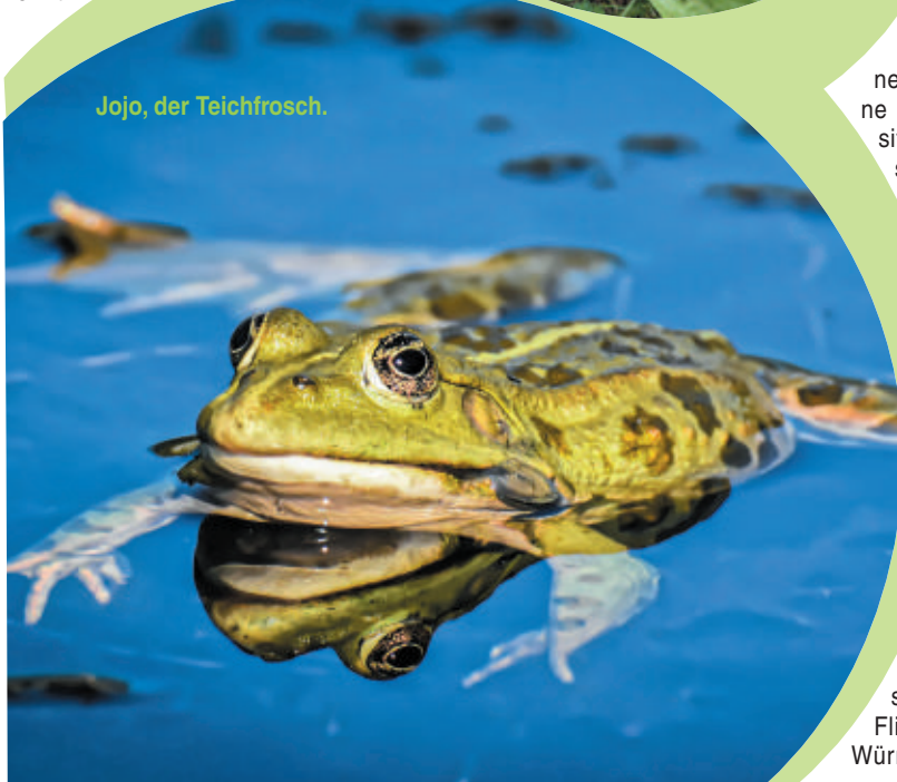
Jojo, der Teichfrosch.

Zuerst lebte er mit seinen vielen Geschwistern nur im Wasser, er konnte wie die Fische mit seinen Kiemen atmen. Kaulquappen bestehen am Anfang fast nur aus einem großen Kopf und einem Schwanz.